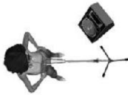
Esther van Dijk Backings